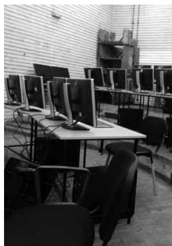
Napuštanje bezbednog režima

Izložbu čini izbor studentskih radova nastalih tokom školske 2017-2018. u okviru predmeta „Transmedijska istraživanja“ i „Diskurzivne prakse umetnosti i medija“ na odseku za Nove medije FLU u Beogradu. Ukupno 20 predstavljenih radova na vrlo jednostavan, duhovit, komunikativan, ali pritom i praktičan način otvaraju mnoga pitanja o društvenom statusu rada u polju umetnosti i ulogama koje danas umetnici preuzimaju.