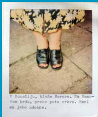
U Soreliju, bivše Soroce, na Beo- van brda, preko puta crkve. Neni su jako udobne.