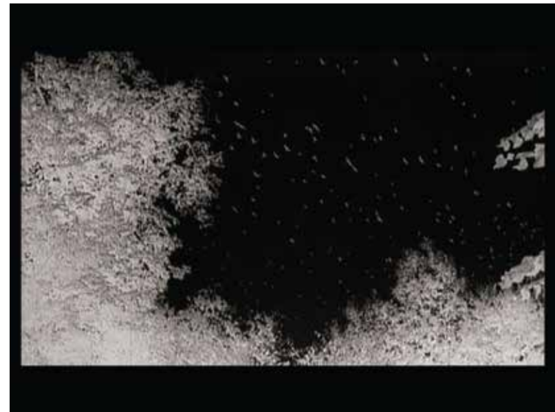
Neli Ružić , Ploča (dve planine) , video SD, stereo sound, 6:26, 2016.

U mojim radovima istražujem lično i kolektivno sećanje i zaborav u odnosu na tranzicijske identitete. Koristim različite medije poput fotografije, objekata, instalacija i video instalacija, te često radim procesualne radove kroz duže vremenske periode. Neki od radova su zamišljeni kao vremenske mašine, a problem vremena, heterohronije i memorije provlači se kroz ceo moj rad. Iskustvo migracije, geografski, istorijski i lični diskontinuiteti odražavaju se u radovima na više načina: od odsutnosti do ponavljanja, tragova i novih ispisa (palimpsest) do transformacija. Preklapaju se društveno i emocionalno, utopije prošlosti i lične mikroutopije, istorija i pejzaž, postmemorija i savremenost. U radovima za izložbu projekta From Diaspora to Diversities dovodim u vezu različite vremenske periode i mesta. Video rad Ploča (dve planine) beleži sećanje mog oca na nestanak njegovog brata u septembru 1943. godine na Mosoru, a video Bandera (611 noches) reakcija je na nestanak 43 studenta u Iquali, Guerrero u Meksiku 26. septembra 2014. godine. Svako jutro se menja legenda uz rad, odnosno cifra noći koji su protekli od nestanka studenata (30.05.2016. na otvaranju izložbe cifra je 611). Rad Treće vreme (2007.) sastoji se od dva analogna sata, jedan s vremenom zone centralnog Meksika i drugi sa srednje evropskim vremenom. Mehanizam kazaljki vuče crni konac iz središnjeg dela koji ih na kraju i zaustavlja.