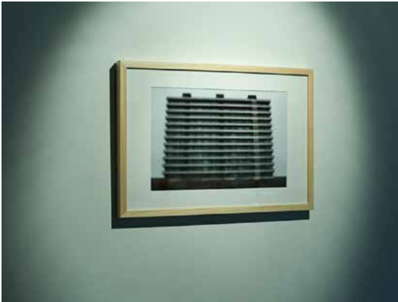
Nermin Duraković , Meanwhile , fotografija, 2015.