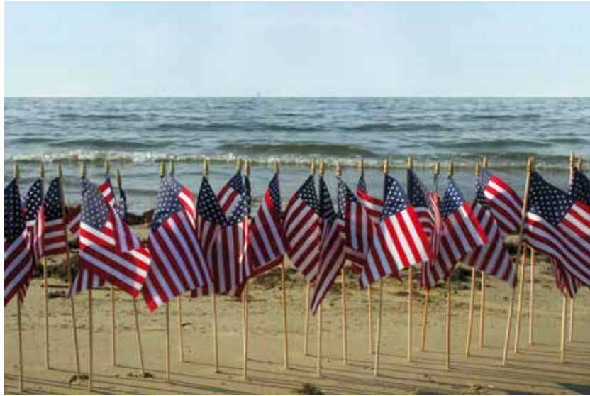
Rajko Radovanovic, Last Line of Defense#1, Marshes of Bayou Rigolettes, Lafitte, 32 miles south of New Orleans, LA, Latitude: 29 - 37'28"N, Longitude: 090-07'35"W, 9. jun 2010, Boatman: Gary Hodges